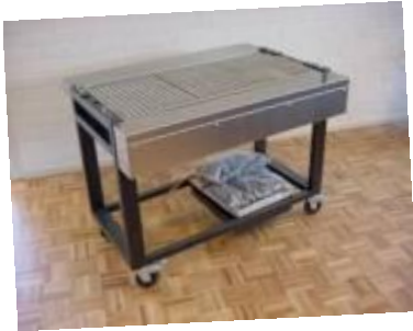
Ivas barbecue & gas